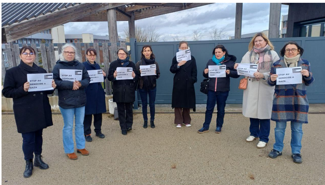
Devant le lycée d'Amboise vendredi 23 janvier 2026 – Stop au génocide à Gaza !