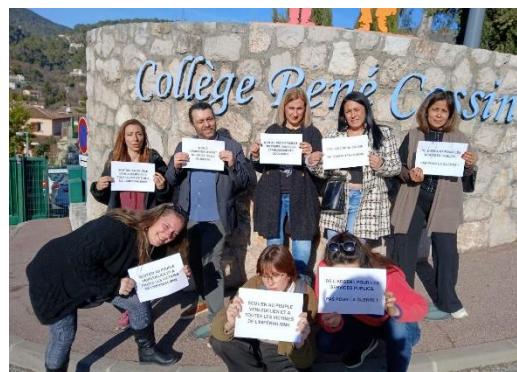
René Cassin à Tourrette-Levens