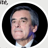
François Fillon devant les patrons le 10 mars 2016

« Le système par points, en réalité, ça permet une chose qu'aucun homme politique n'avoue : ça permet de baisser chaque année le montant des points, la valeur des points, et donc de diminuer le niveau des pensions. »